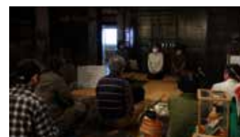
▲ろばたばなしの様子