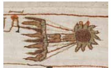
「バイユーのタペストリー」に描かれたハレー彗星▲ このときのハレー彗星はイングランド王ハロルド2世の戦死と結びつけられた