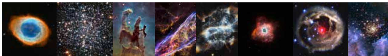
▲天の川を彩る天体たち

土曜日 午後2時～ / 日曜日、夏休み(8月28日まで) 中の水・木曜日 午前11時～、午後2時～