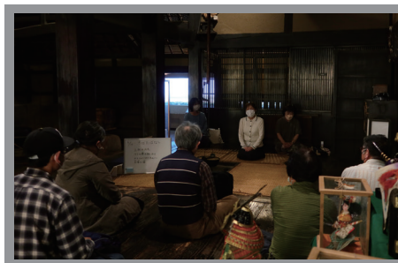
▲ろばたばなしの様子