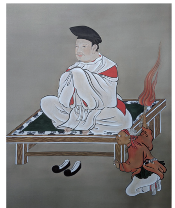
安倍晴明肖像