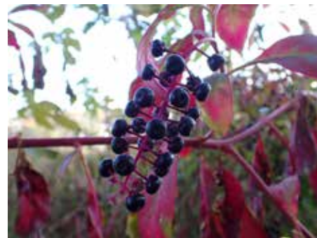
▲色づいたヨウシュヤマゴボウ