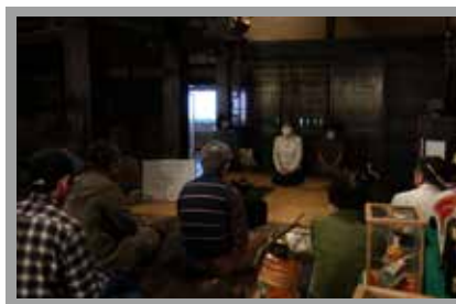
▲ろばたばなしの様子

事前申込制行事は右のQRコードから申込ができます。（博物館HPからも申込できます）