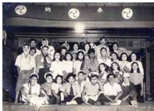
▲お祭りの素人演劇 昭和23年4月28日 平塚市大島 地域の青年たちによる祭礼での素人演劇