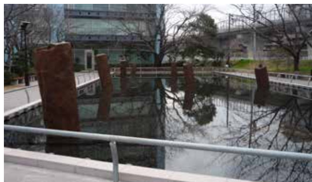
▲大正関東地震による液状化によって、地中から出現した 鎌倉時代の橋脚レプリカ(茅ヶ崎市下町屋)