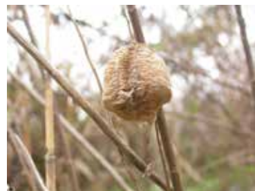
▲オオカマキリ卵鞘

カマキリまたはカマキリの卵（卵鞘）の写真を募集しています。見つけたら写真を撮って送ってください。随時お待ちしております！