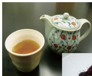
◀ ゲンノショウコのお茶