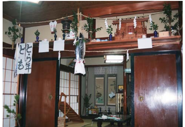
新年の神棚 左方が年神棚(岡崎)