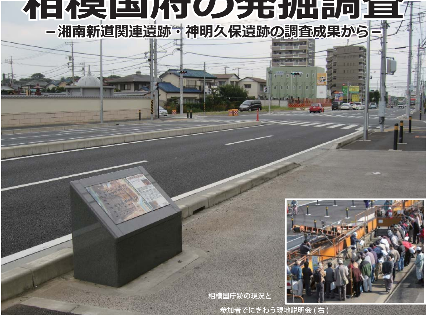
相模国府跡の現況と