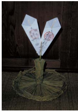
サンダワラボッチに挿した 年神札(入野)

祠の横に年神の御札を見ることができます。「大年神 御年神 若年神」などと刷った御札です。この御札をサンダワラボッチに立てたり、輪切りの里芋や大根に挿したり、祠に入れたりして年神棚にまつります。年神をはじめ、大神宮様やえびす様、荒神(こうじん)様、井戸、物置の戸など、神さまが宿りそうなすべての場所にしめ飾りをします。