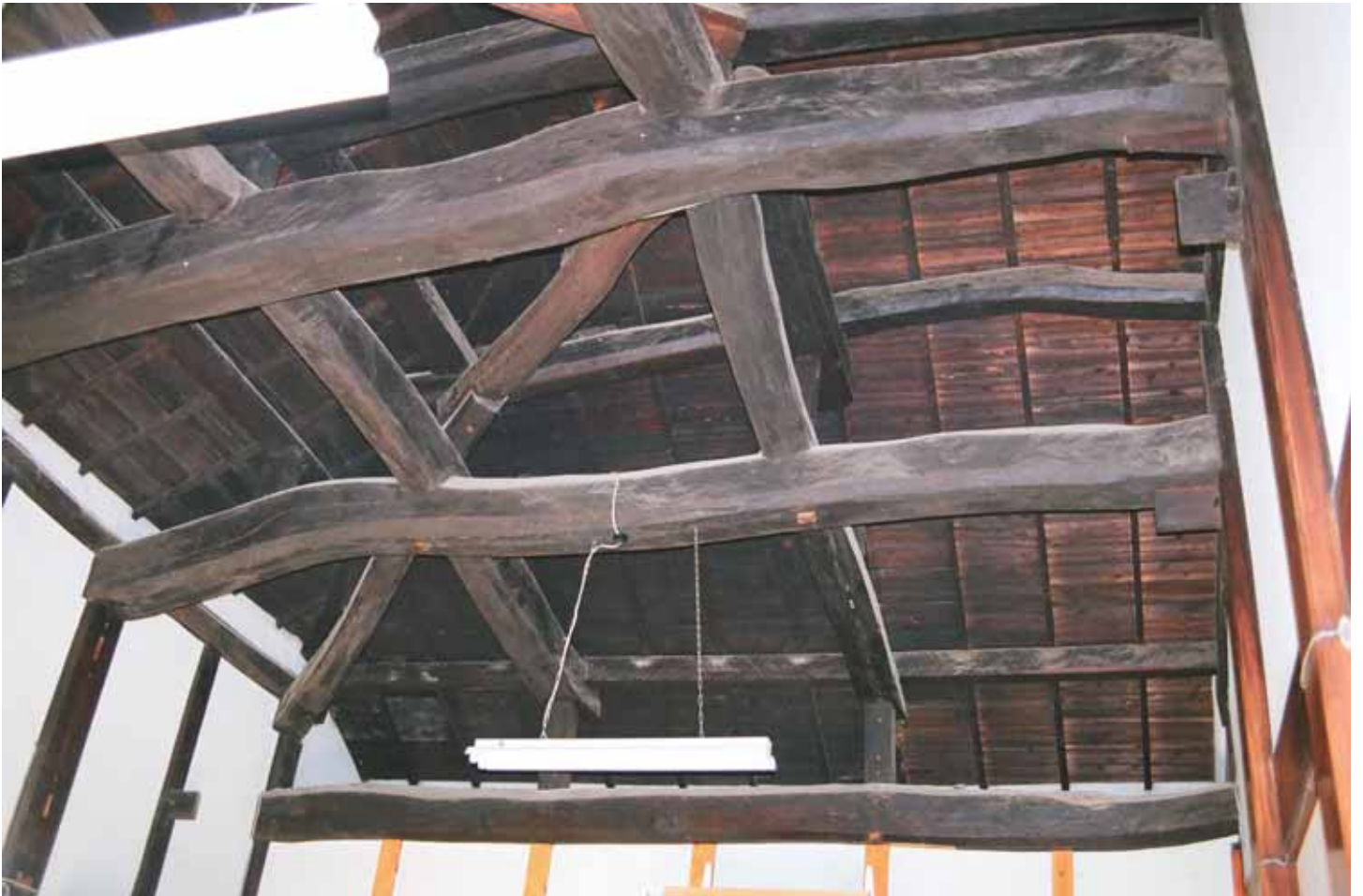
てんじょう板を張らず、屋根裏まで素通しの民家 西真土