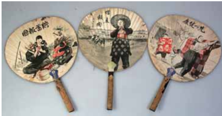
昭和 10 年代のうちわ

蚊帳吊る前におふとんの上に広げとくでしょ。そしたら勇な んかはしゃいじゃって、「海だあ」とか言って蚊帳の上で泳い でんだよ。まあ、にぎやかだったね。