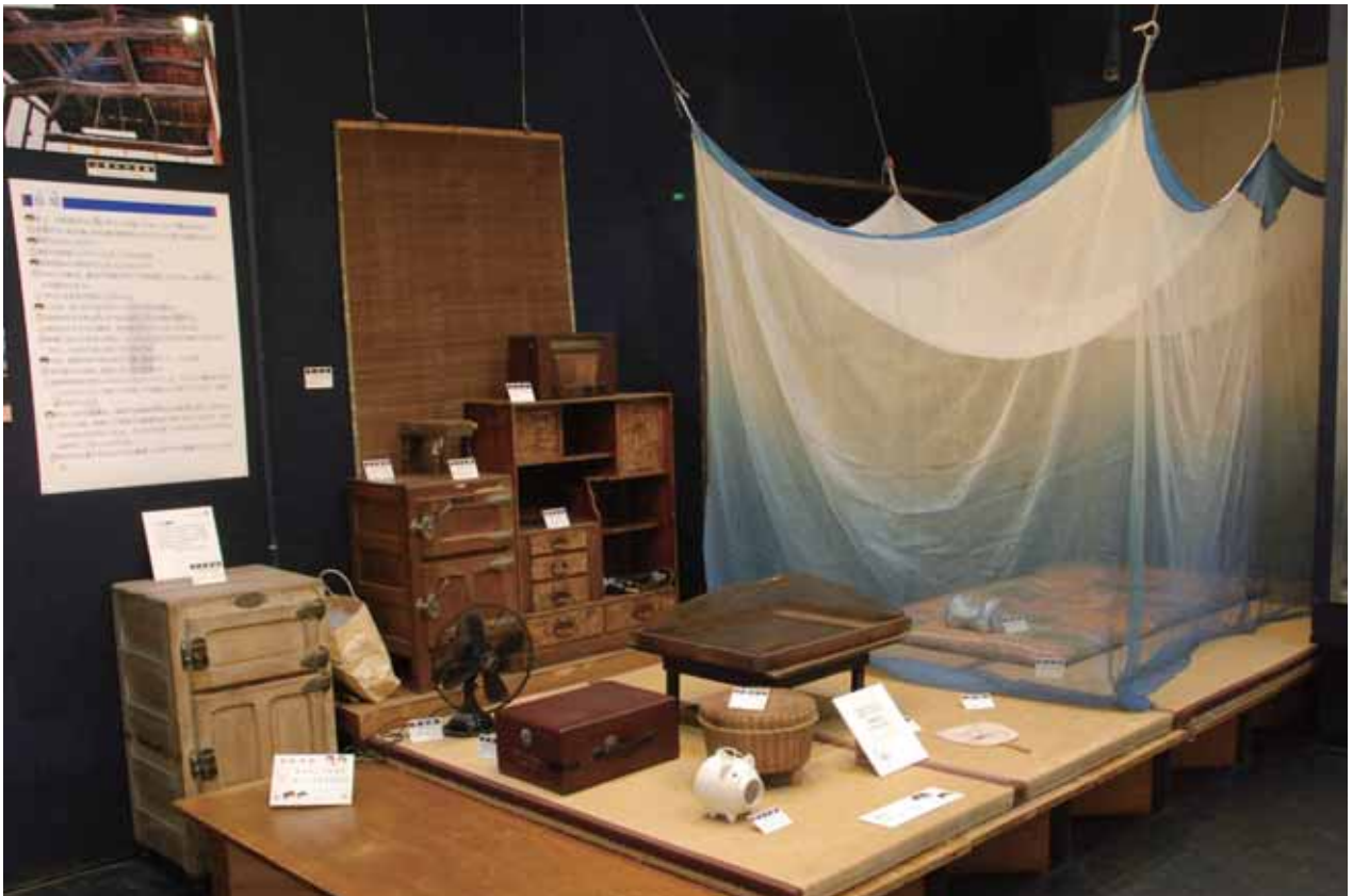
かやぶくろ 蚊帳を吊った展示