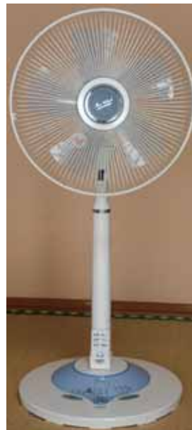
現代の扇風機 せんふうき

家庭にエアコンが普及し始めた昭和40年代は「クーラー」と呼ばれ、冷房 れいぼう と送風 そうふう のみで、暖房 だんぼう はなかった。