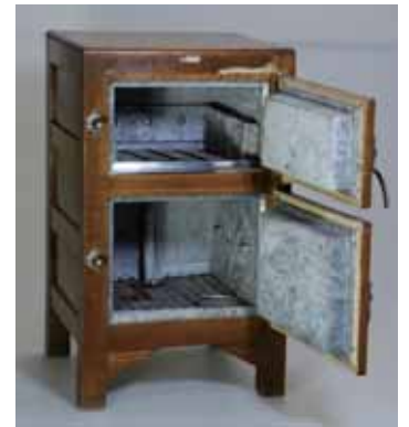
氷冷蔵庫 上段の氷室 に氷を入れて冷やした。