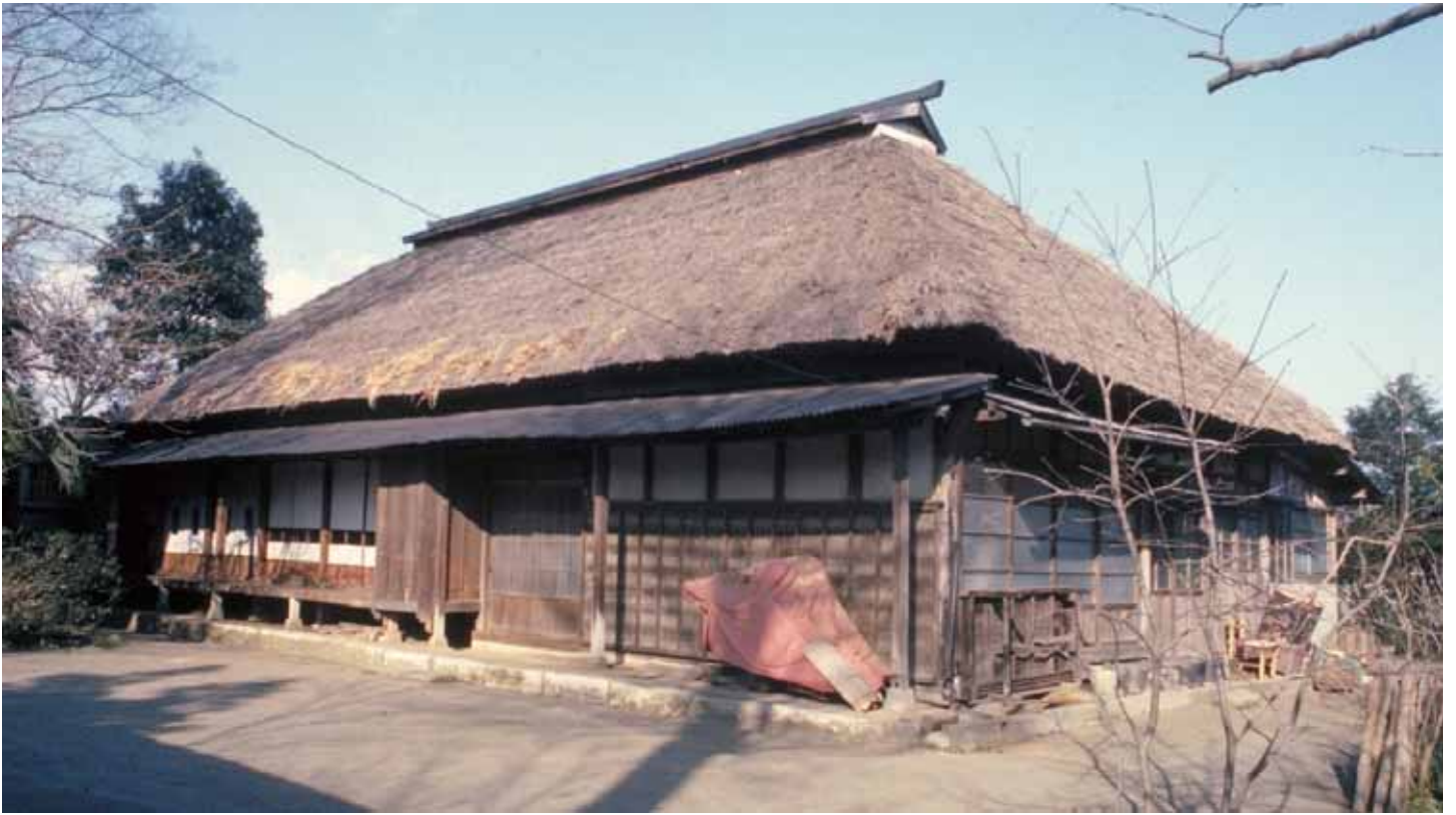
草ぶき屋根の民家 昭和50年 徳延