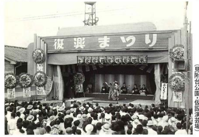
自附台公園に仮設演芸場