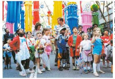
第二十八回平塚七夕まつり