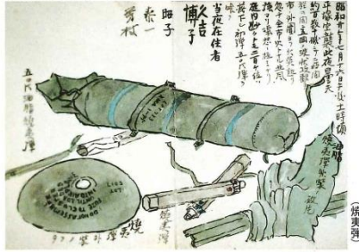
杉山久吉 「路傍破片」 (絵日記)