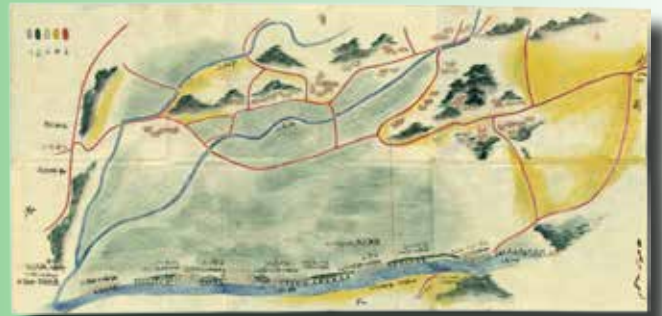
相州大住郡土屋村之内字庶子分寺金目川通堤切所之絵図面 明治元年(1868)10月 平塚市博物館寄託