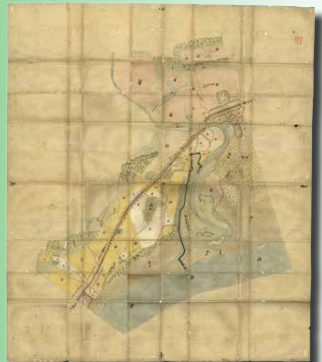
平塚村・大磯村浦境争論裁許絵図 元禄5年(1692)9月18日