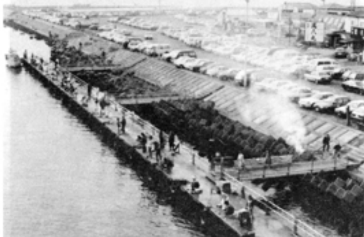
相模川河口の海釣り基地