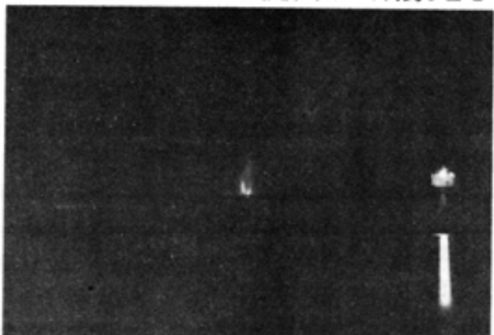
平塚海岸から見た大島大噴火