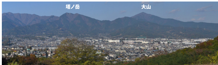
大磯丘陵からみた丹沢山地表尾根の山並み

平塚の北西にそびえる大山を東端に、神奈川県と山梨県にまたがる広大な丹沢山地は、700万年前に本州に衝突した、かつての火山島でした。本展示では、丹沢山地を作る岩石や、そこでみられる鉱物、化石に基づき、丹沢山地のダイナミックな成り立ちや、そこからわかる南関東地域の大地の特色について紹介します。