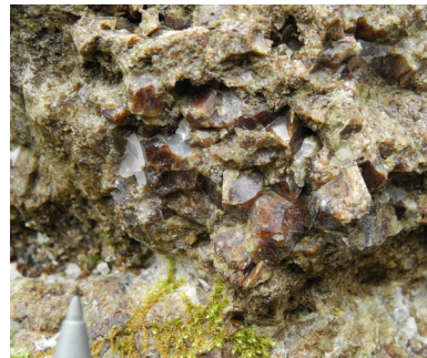
県の天然記念物である白石沢(山北町)の含ベスブ石結晶質石灰岩