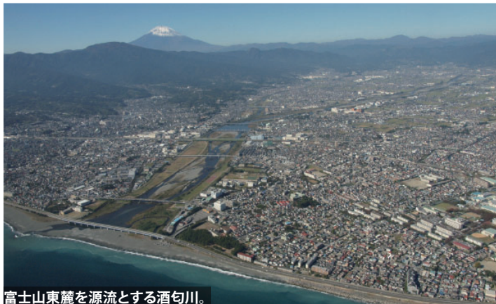
富士山東麓を源流とする酒匂川。

山梨県から神奈川県をまたいで、平塚で相模湾にそそぐ相模川は、500 万年以上前のプレート境界にできた川です。そして静岡県から神奈川県をまたいで、小田原で相模湾にそそぐ酒匂川は、現在のプレート境界上を流れる川であり、二つの河川は世界でもまれな生い立ちの、いわば兄弟のような川なのです。本展示では、そんな神奈川県内を流れる二つの川にスポットを当て、その成り立ちや、地質学的な見どころ、美しい景観などをご紹介します。