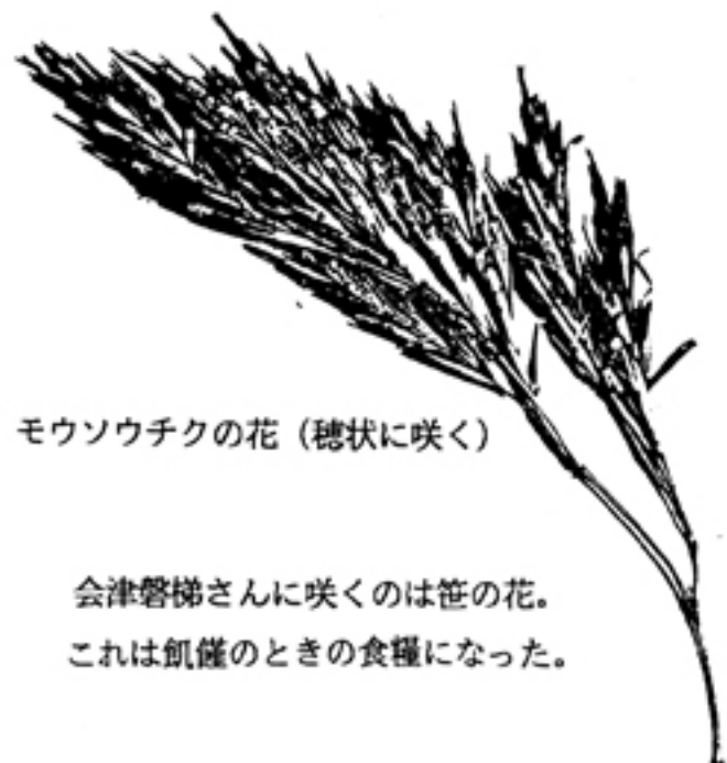
モウソウチクの花 (穂状に咲く)