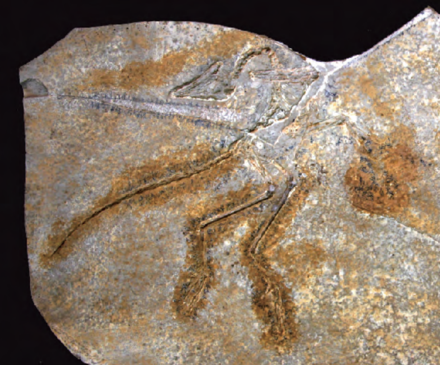
↑始祖鳥化石【ドイツ アイヒシュテット】(レプリカ) ←緑柱石(エメラルド) 【コロンビア】(寺島靖夫氏所蔵)