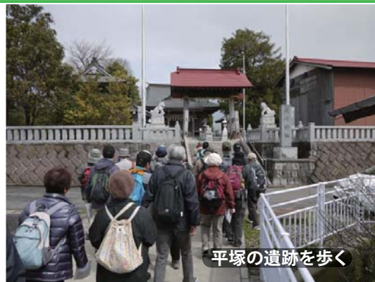
平塚の遺跡を歩く