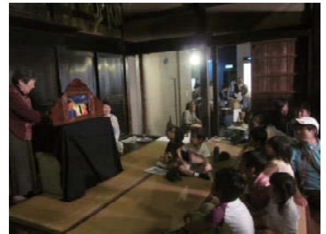
紙芝居でみなさんと一緒にフェスタの終わりを迎えました。

昔の道具で、今ではあまり使っていないものも用意しました。石臼でした。それを使ってひいた米の粉は午後のだんごづくりの材料になります。こどもたちの待ちきれない様子は微笑ましいです。屋外では、もっと昔の生活を体験できるイベントも用意しました。弓矢と火起こしです。最初はうまくいかないですが、コツを捕まえると意外にやりやすいです。