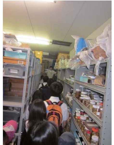
初めて見た博物館の裏側。 想像とっしょだったかな?

最後に一日のイベントの幕を閉めるのは紙芝居です。古い民家のなかで、ボランティアたちは色々な物語を用意しました。今年のこどもフェスタはみなさんのおかげで盛り上ります。来年もみなさんの参加を待っています!