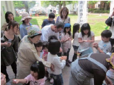
おいしいおだんごになれ!

そしてこどもと言えば、やはり遊ぶことは大事、そのため博物館では昔の遊び道具をいっぱい用意しました。今のこどもにとってはあまり見たことがないものかもしれません。キャッキョッしながら遊んで楽しそうな笑顔がいっぱい。