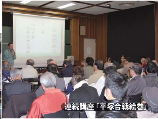
連続講座「平塚合戦絵巻」