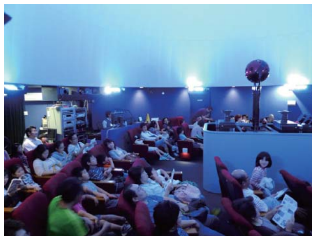
満員のプラネタリウム (5月20日)