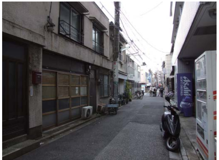
かつて新吉原江戸町二丁目、伏見町と通称された台東区千束町の通り。二十八宿道標寄付に尽力した新龍ヶ崎楼があった。

あるいは道端に倒れ、あるいは苔むした全道標写真に、台東区図書館よりお借りする明治の吉原史料をまじえて展示し、星の名を用いたお洒落な道しるべと、これを寄付した吉原の人々の足跡を探ります。