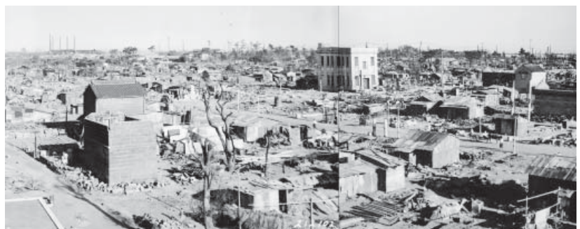
被災状況－現東海道本通りと不動通りの交差点付近