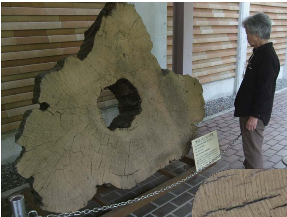
神代杉の輪切り標本と年輪