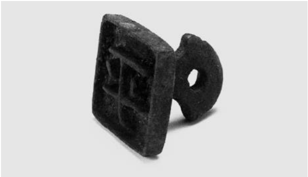
構之内遺跡出土 「平」の銅印 (十世紀、平安時代)

万田八重窪横穴墓の調査が行われたのは、明治31年。この年が平塚市の考古学の出発点となります。今年ちょうど百周年を迎えることになりました。その節目として、近年の成果を踏まえての「相模国府とその世界」をテーマとし、初期国府を、大住国府に視点を置きながら、相模国に展開された郡・郷の世界を垣間見るものです。