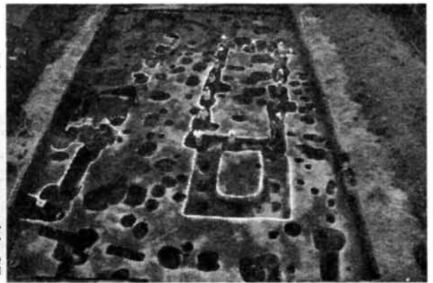
▲七ノ域遺跡の長大な堀立柱建物跡