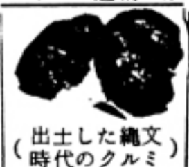
出土した縄文(時代のクモガタ)

昭和48年度からの継続事業である岡崎上ノ入遺跡は、本年度をもつて最終発掘調査となりました。この調査で、縄文～鎌倉時代にかけての遺構が類々と検出され、多大な成果をあげることができました。今回の調査中毎週土曜日計4回の見学会を催し、延500人程の見学者が押しよせました。