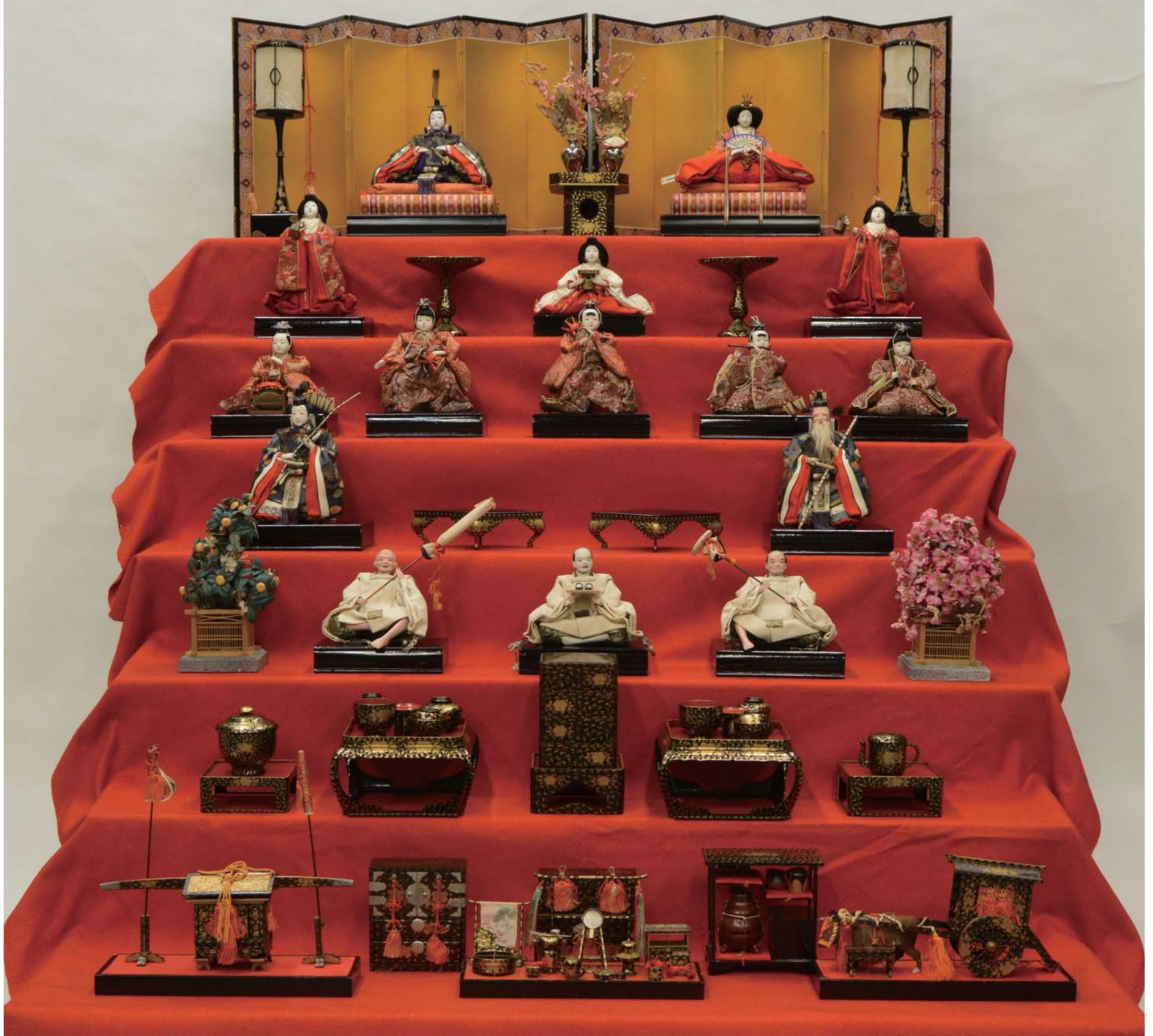
昭和16年のお雛さま 八重咲町 椎野綾子氏寄贈