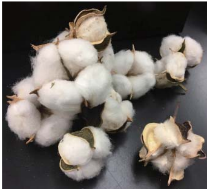
←綿の種子を包むふわふわの繊維がいわゆる綿花。

皆さん、綿という植物をご存知でしょうか。以前は、日本各地で栽培されていましたが、近年ではすっかり見られなくなってしまいました。東海大学教養学部の藤吉研究室では、その綿がどのような姿で、どのような魅力を有しているのか、それらを学ぶために畑で栽培し、その利用について考えています。綿を使って遊びましょう。