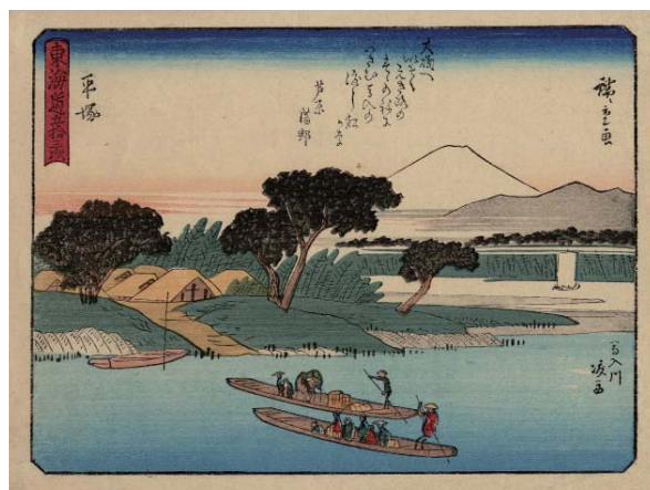
歌川広重筆 狂歌東海道平塚 馬入川渡船