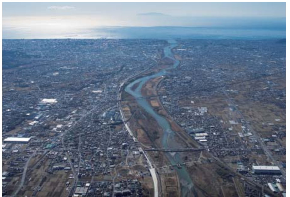
↑平塚のまちの大部分は、相模川と海が作った平野の上にあります。このような地形の成り立ちは、地盤とも深く関係します。

本展示では平塚周辺の地盤について、その特性や地形との関わり、成り立ちの歴史などを紹介します。また、周辺の活断層や、予想される地震とその被害についても最新の情報をお伝えします。