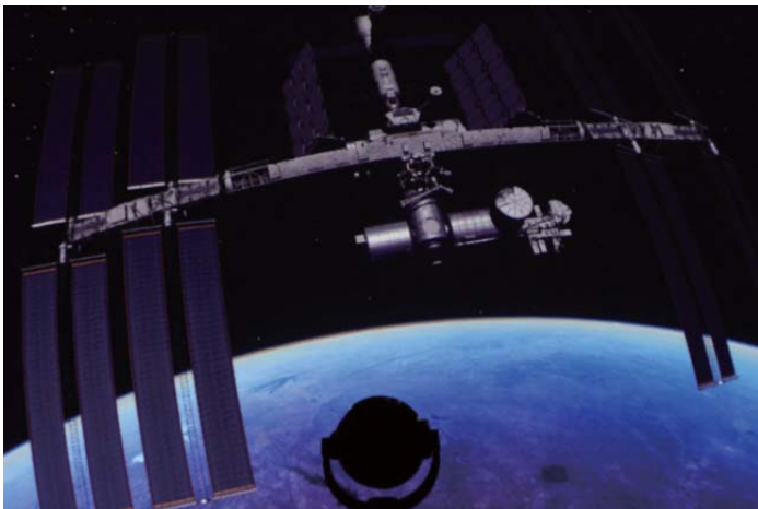
ユニビューで投影した、国際宇宙ステーションから見下ろした地球

2012年10月のプラネタリウム音響・映像機器更新に伴い、新しいデジタルプラネタリウムのソフトウェア「Uniview (ユニビュー)」が搭載されました。デジタルプラネタリウムは、言わばパソコンの画面に映し出された星空を丸い天井(ドーム)に投影するものですが、ユニビューは地上から見た星空だけでなく、宇宙に飛び出して国際宇宙ステーションから地球を見下ろしたり、太陽系の惑星たちに近づいたり、果てには天の川銀河(銀河系)を外から眺めたり、宇宙の大規模構造を見渡したりすることができるのです。これからこれらの機能も活用して投影を行っていく予定ですので、ご期待ください!