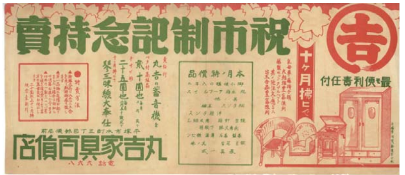
「祝市制記念特売」チラシ 丸吉家具百貨店

昭和7年(1932)4月1日、平塚町は市制を施行し、平塚市として県下4番目の市を発足させました。市制施行を受けて、市内は市制祝賀にわき、商店街では記念セールなどさまざまなイベントを催し、市制施行にちなんだチラシを作成しました。