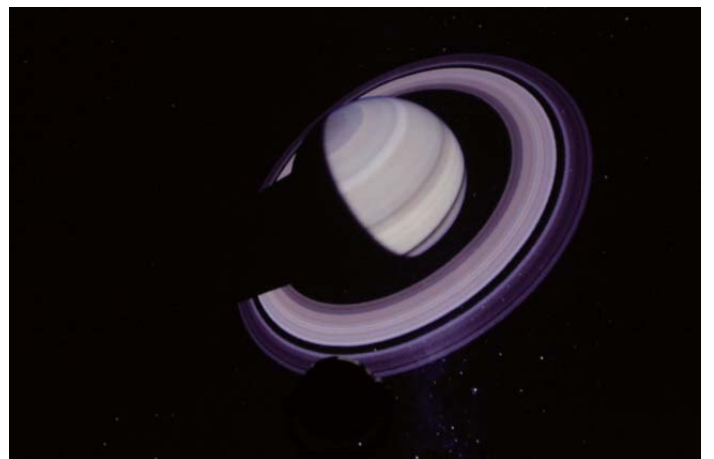
ユニビューで投影した、迫力ある土星の姿