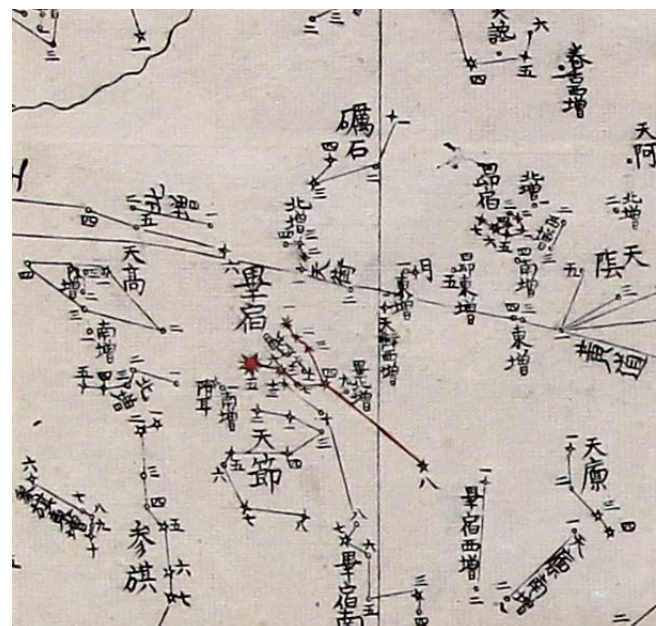
中星候辰表(部分)：左図と同じ星の部分です。等級により星を描き分けています。縦線は赤経の目盛線です。

また星の描き方に等級差を用い、星宿の線に代って緯度経度の目盛線を設けている点も「天文成象」と異なり、西洋天文学の影響が見られます。