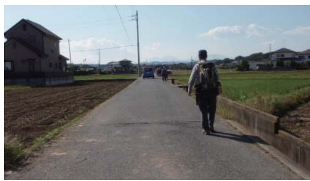
第2回 金目川の旧河道を歩く