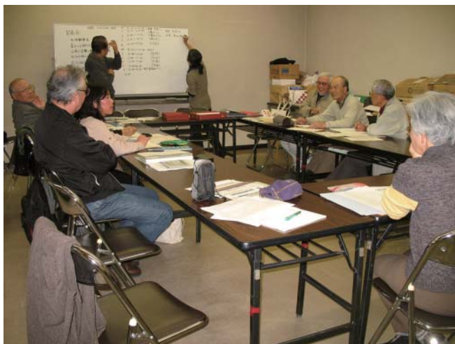
4回目の実行委員会(12月10日)

平塚市博物館は、市民に開かれた運営で全国に知られます。とくに会員制の行事を数多く実施し、サークル活動によって参加者の資質を高め、調査収集の面でも成果を上げているのが大きな特徴です。