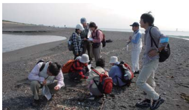
第1回 平塚海岸にて

※ 行事の様子を写真で紹介した「金目川を歩く写真展」を1月4日から2月8日まで2階情報コーナーで開催しています。