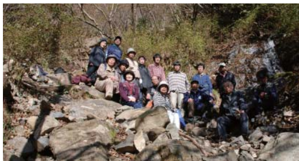
第4回 春岳沢水源にて