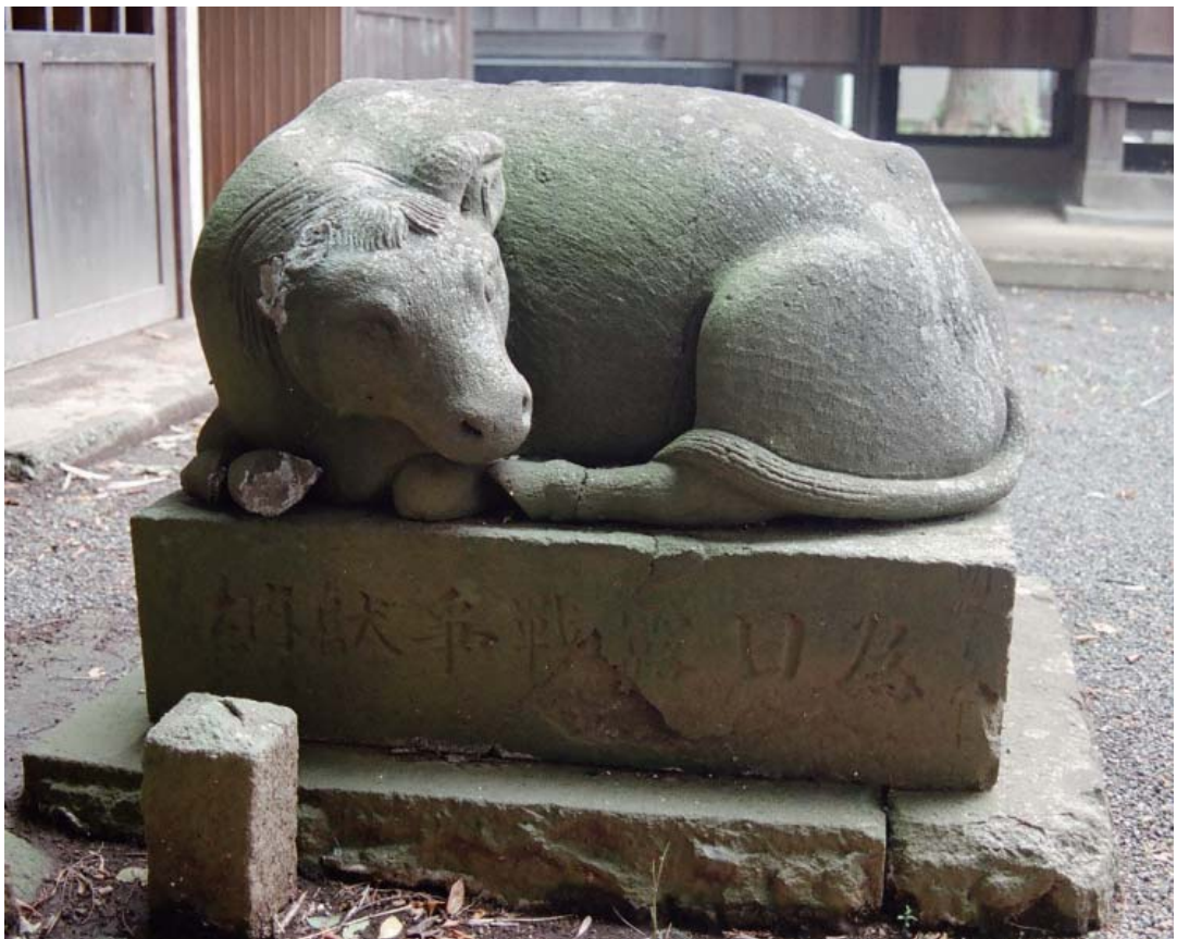
牛の石像（城所 貴船神社）

明治時代、日露戦争の戦勝祈願に城所の三面大荒神社へ奉納された石像。同様の牛像が日清戦争の勝利記念に城所の個人宅へ奉納されている。なぜ、牛なのかは不詳である。