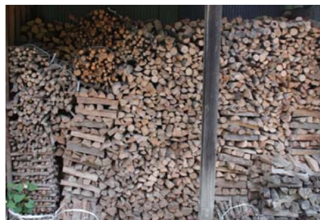
民家に積みあげられたマキ（平塚市土屋）