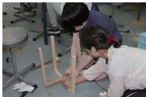
渾天儀の模型を製作中

ふだん私たちが接しているスケジュール帳やカレンダー。そこにある暦にポイントを置き、日本の暦の歴史を紐解いていきます。実際、太陰暦や太陽暦、旧暦などといった単語は目にしたことはあれど、どのようなものかまで考える人は少ないのではないのでしょうか。日本が昔どのような暦を使っていたのか、いつから日本独自の暦を使い出し、いつ頃から世界共通の暦となったのでしょうか。これを少しのきっかけとして日ごろ疑問にも思わず受け入れているものを改めて知っていただければと考えています。