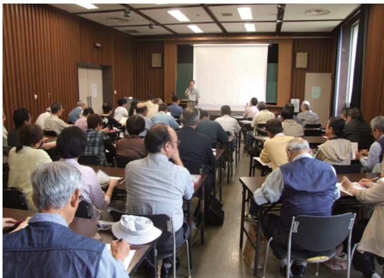
平成23年度平塚学講座「開講講義」