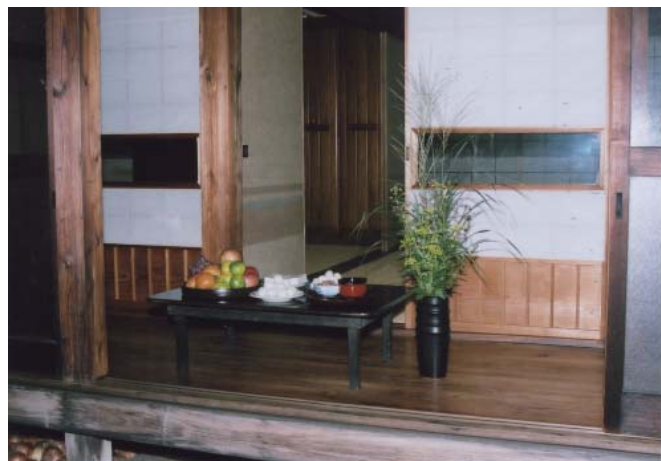
十五夜のお供え（平塚市山下 2005年）