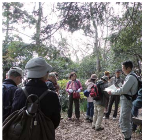
平成23年度平塚学講座「野外活動」