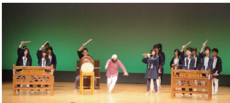
第3回フェスティバルより二宮町中町囃子保存会の舞台発表