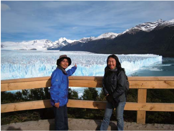
パタゴニアで氷河の前に立つアクアマリン

投影日 4月8日までの土、日曜日 3月28(水)、29日(木)、4月4日(水) 午前11時 午後2時