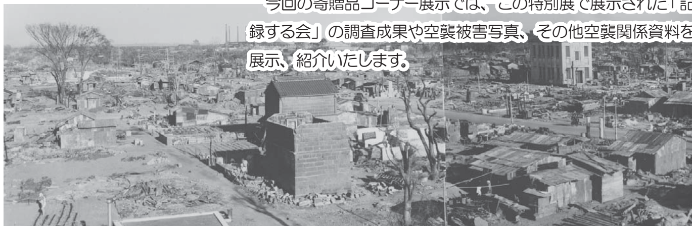
空襲被災後の平塚市街

今回の寄贈品コーナー展示では、この特別展で展示された「記録する会」の調査成果や空襲被害写真、その他空襲関係資料を展示、紹介いたします。