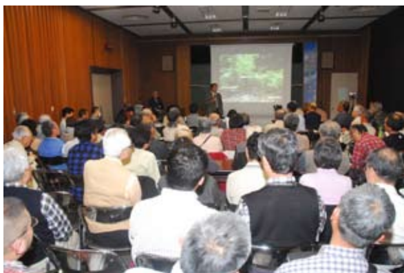
4月24日のサイエンスセミナーでの講演

「サイエンスセミナー」では、講師の先生から今回の地震についての解説もあり、予定時間をオーバーしても熱心に最後まで聴講されていました。「展示解説と上映」では、展示室内では解説できず、講堂にて映像を使って解説し、終了後も展示室内で1時間に亘ってそれぞれの質問に答えました。来館者も展示を熱心に観ていられる方が多く、図録も完売しそうな勢いです。また、前回の特別展「平塚周辺の地盤と活断層」の図録や地盤図も大変好評です。