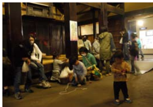
博物館内古民家での「むかしの子どもあそび」ではこま回しやお手玉で遊びました。