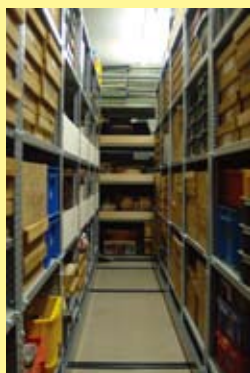
地域資料が保管される収蔵室(第2収蔵室)

博物館は地域のアルバムともいえます。博物館が所蔵する資料は、いわば家族にとっての家族写真であり、地域の記憶を伝え、地域のこれからを考えるための大切な財産です。この資料を虫やカビの害から守るために、必要に応じて「くん蒸」という作業を行なっています。資料に対しては影響の少ない薬剤によって、殺虫殺菌処理をするものです。