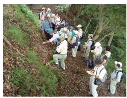
相模川の生い立ちを探る会