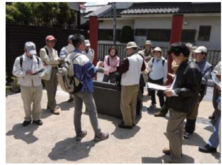
平塚の古代を学ぶ会

当番制で博物館の来館者へ展示の解説をします。 定例会：月2回 第1第3木曜日 午前9時30分～12時 当番日：週1回 午前9時30分～午後4時 募 集：10人