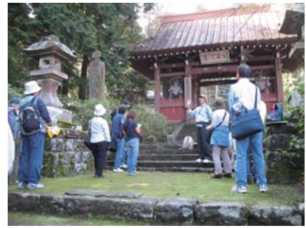
星まつりを調べる会

申込方法（各会共通） ■ 往復はがきに応募者の郵便番号・住所・氏名・年齢・電話番号と希望する会の名称を記入し、博物館までお申込みください。 ■ お手数ですが一行事につき一通お送りください。 ■ 締切りは4月1日（必着）です。応募多数の場合は抽選となります。