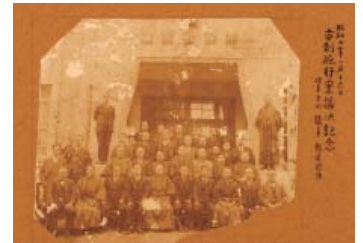
写真「市制施行案議決記念」

丹沢山麓は全国で最も多く狼の頭骨が残されている地域です。オカシラを狐落としに用いる習俗があったためと考えられています。本資料は江戸末か明治初に秦野市寺山の旧家が所有したものです。（民俗）