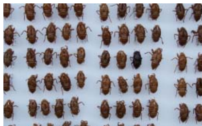
平塚のセミの抜け殻

昭和7年(1932)中郡平塚町が市制施行案を議決した記念に、町役場前で理事者らが撮った写真です。（市史）