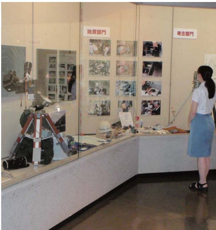
寄贈品コーナーの「学芸員の七つ道具」展