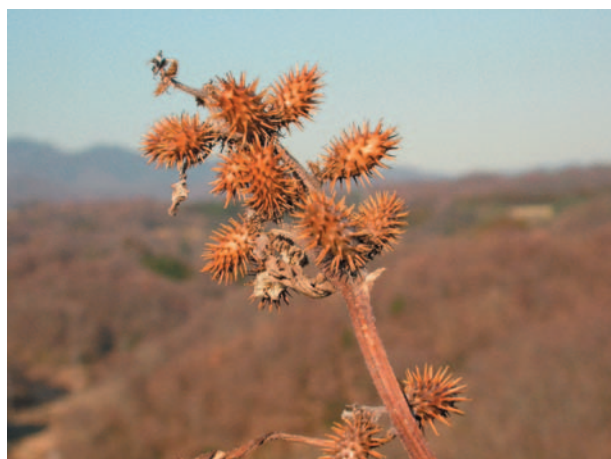
写真 典型的なひつつき虫（オオオナモミ）

どんな草木も花が咲き、実がみのります。その実は、なるべく広い範囲に子孫を残すために、さまざまな力を利用して旅をしようとしています。あるものは風の力を借り、