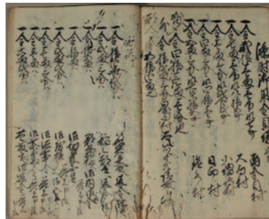
安永7年(1778)南金目村領主中条氏臨時御用金目録と御用金使途内訳 (博物館寄託文書)