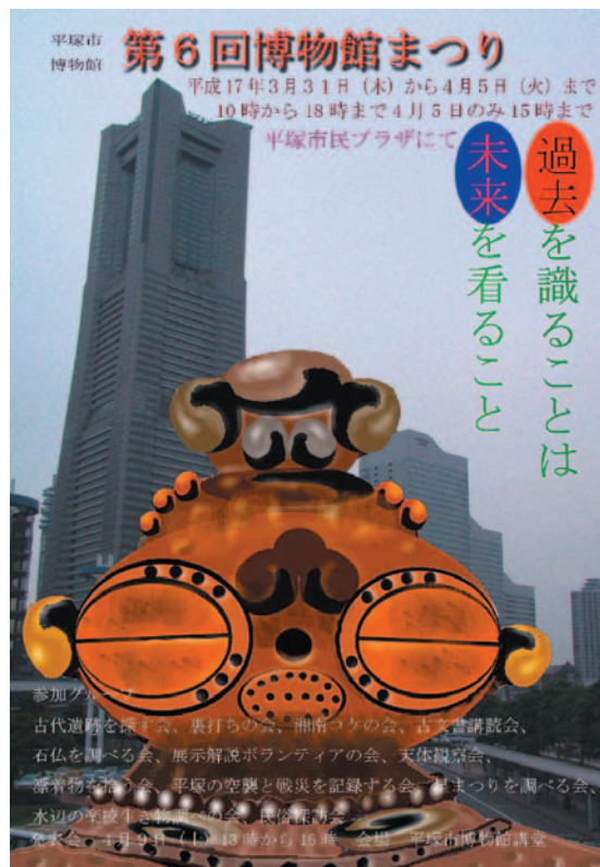
写真 各サークル手作りのポスター

また、4月9日（土）には博物館講堂にて博物館まつり発表会を催します。こちらも楽しみに。