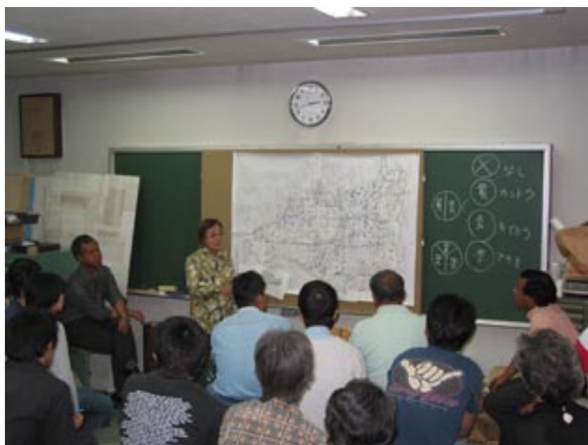
【写真】→ タンポポ調べの結果の発表会のようす (2003年5月)

いテーマもあります。今後、そうした宿題を片づけるとともに、20年前のデータとの比較調査を進めていきたいと考えています。来年以降、参加の呼びかけがありましたら、ぜひ仲間に加わってください。