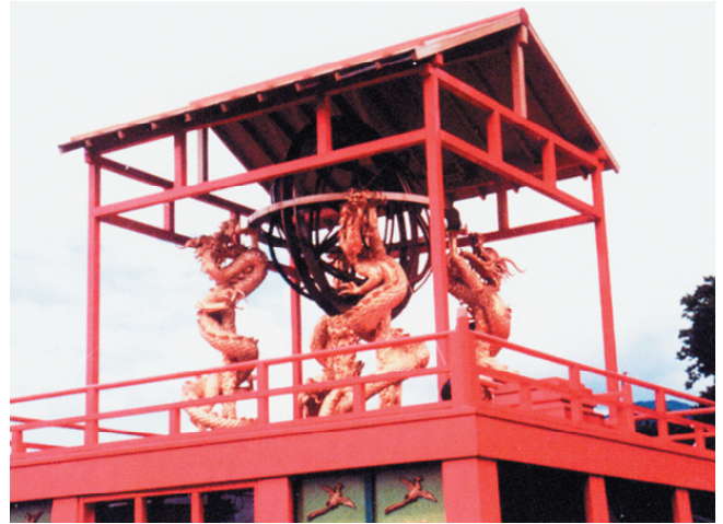
古代中国の天文観測儀器「渾天儀」(復元)

星座には、それぞれの民族がどのように星空を見ていたかをあらわすという、文化的な側面もあります。中国・日本で用いていた星座を眺めて、私たちの祖先の宇宙観に触れてみませんか？