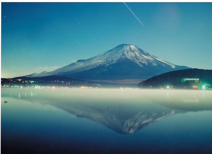
優秀賞 月光の富士山 増田智生